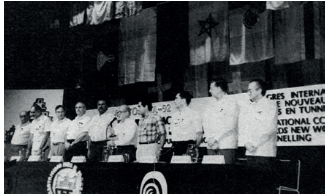
▲ Inauguración del Congreso en 1992.