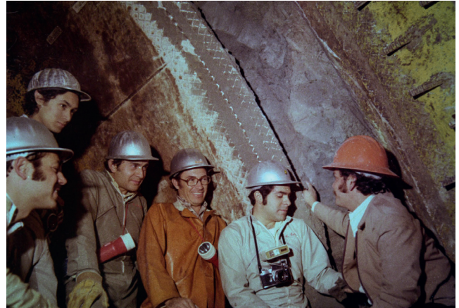
▲ Drenaje profundo de la Ciudad de México.

Hoy que dejas este Consejo Editorial queremos agradecerte por todo lo que has brindado: tu trabajo, tu compromiso, tus enseñanzas y, sobre todo, tu amistad. Para nosotros y para todo el gremio de ingenieros apasionados por esta disciplina que tanto nos entusiasma, tu legado significa inspiración y orgullo.